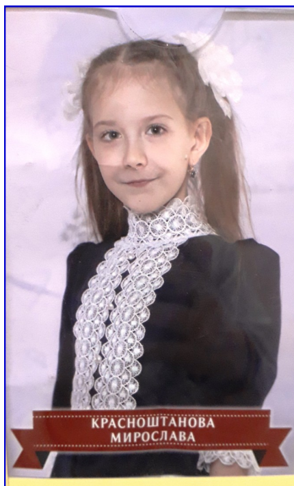
Фотография с Доски почета