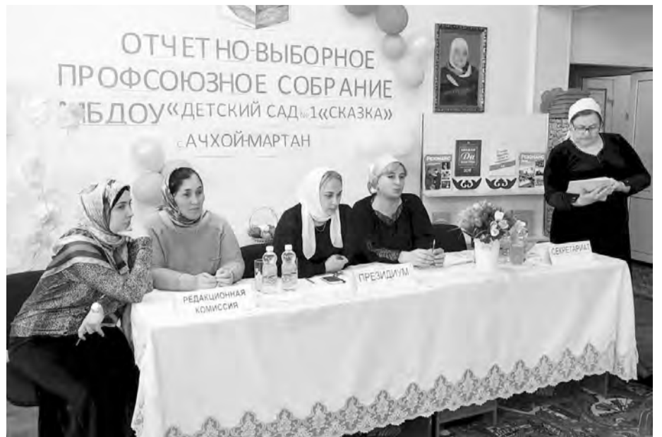
В детском саду №1 «Сказка» села Ачхой-Мартан

Наша газета в этом году уже подробно рассказывала об уникальной структуре управления, которая создана в Чеченской республиканской организации профсоюза. Напомним, что она включает в себя республиканский совет, уполномоченных в округах, представителей рессвета в районах, кураторов первичных организаций в районах, председателей и уполномоченных первичных организаций. В соответствии с решением президиума республиканского совета профсоюза отчетно-выборные собрания в первичных организациях были проведены с 1 марта по 1 апреля текущего года. Такие сроки были установлены для минимального отрыва педагогов от работы и максимального использования каникулярного времени.