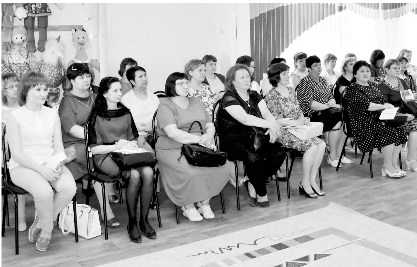
Секция в детском саду №145 собрала профлидеров дошкольных учреждений

- Я впервые на слете. Приятно проникнуться этой атмосферой, узнать о работе своих коллег по «профсоюзному цеху». Профсоюзный актив - это интересные, яркие люди, общение с которыми доставляет истинное удовольствие. На своей работе я организую туристско-краеведческую деятельность, занимаюсь спортивным туризмом, готовлю детей к соревнованиям, слетам. Коллектив у нас небольшой - всего восемь основных работников плюс совместители. Все состоят в профсоюзе. Я считаю, что без этой организации сегодня никуда - и в радости и горе профсоюз всегда рядом.